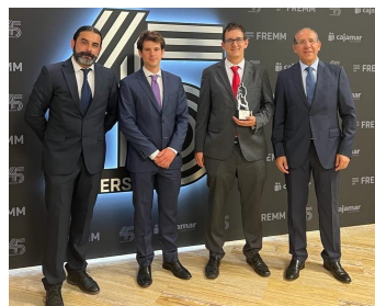
El equipo de MECÁNICAS BOLEA al completo